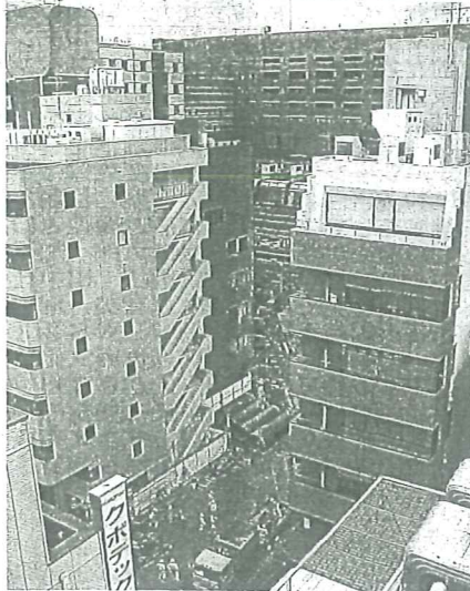
①マンション建設が相次いでいるJR博多駅周辺② ③カプセルホテルの跡地でマンション建設が進む。奥は西日本シティ銀行本店④1日午前、福岡市博多区博多駅前3丁目